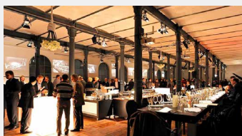
Magazin in der Heeresbäckerei